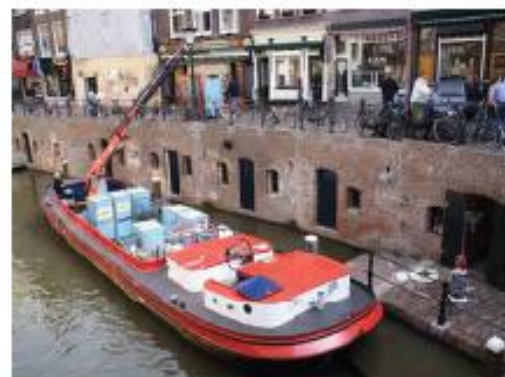
Vervoer over water, Utrecht