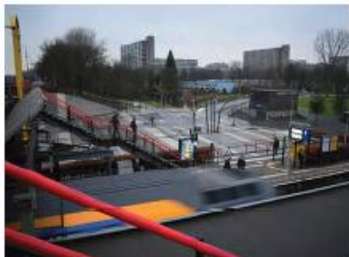
Station Delft Campus