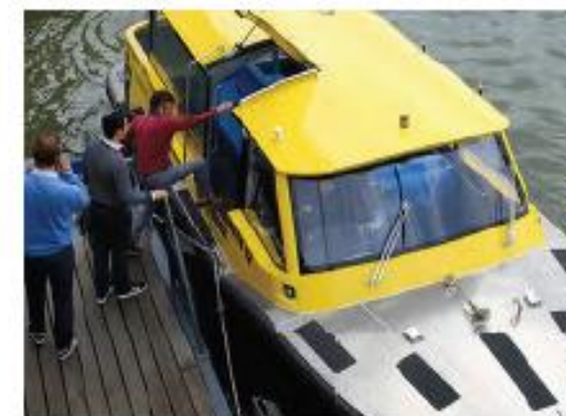
Water Taxi, Rotterdam