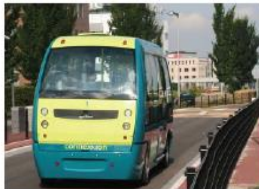
Nieuwe vorm van openbaar vervoer